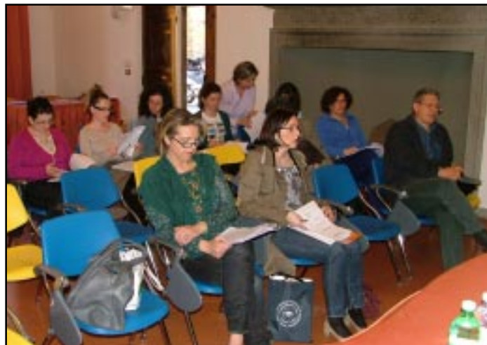
L'assemblea del 13 aprile ▲

4) Collaborare con la Federazione Nazionale e con il Coordinamento regionale all'orientamento e alla diffusione delle rinnovate competenze e della nuova cultura professionale, per facilitare e