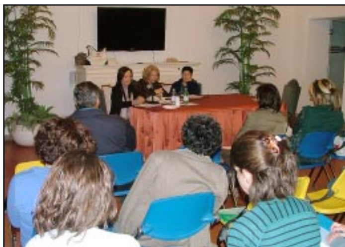
L'assemblea nella sala delle Vele ▲