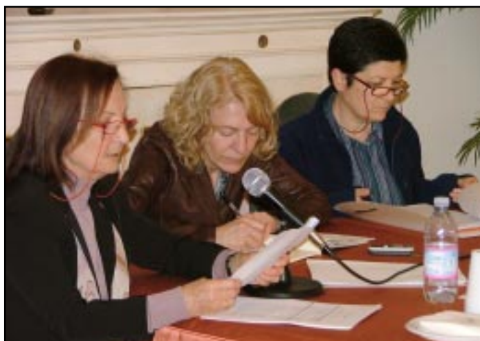
La presidenza dell'assemblea ▲

tarie della Croce Rossa: è stato approvato il decreto sul loro percorso formativo. Percorso ristretto che da loro abilitazione a fare le stesse cose che fanno gli infermieri per i quali è invece previsto un percorso di studio complesso e ben strutturato in ambito accademico. Questa tematica è propagazione diretta del Ministero della Difesa e non è stato possibile alla Federazione far capire la criticità che si va a creare. Niente di personale contro le crocerossine ma non rimane che adire al Consiglio d'Europa.